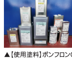
▲【使用塗料】ボンフロンGT