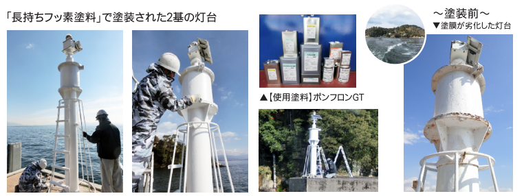
「長持ちフッ素塗料」で塗装された2基の灯台