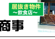
居抜き物件 ～飲食店～

※詳しくはお気軽にお問い合わせ下さい。 〒526-0063 長浜市末広町240-6 ワイエフビル17 ■営業時間/9:00～17:00 ■定休日/日曜日 Tel.0749-63-6478 不動産賃貸管理業 有限会社 ワイエフ商事